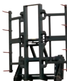
V 500 1