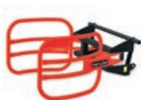
C 30 1