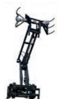
V 60 2,3