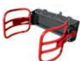
C 40 1